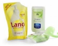
Såpe- /shampoflasker o.l