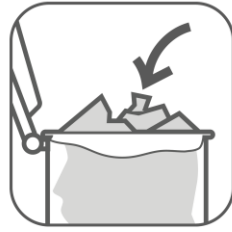
Putt oppi pose og kast plastemballasje i posen