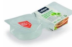
Kjøtt-, fisk- og påleggsemballasje i plast