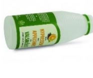
Flasker uten pant. OBS! Ta av korken først!