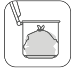
Knyt posen før du legger den i plastsekken

NB! Bøtta tåler hard komprimering, men det gjør kanskje ikke kjøkkenskuffen/skapet ditt. Ta den ut på gulvet før du komprimerer.